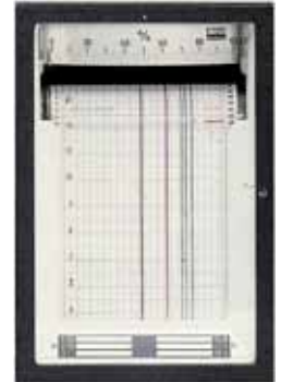
192 x 288 mm ( B x H )

Angebotsgültigkeit : ca. 2 - 3 Monate nach Erstelldatum dieser Preisinformation, sofern nicht anderes angegeben Preisstellung : aussch. Verp.-Kosten ( bei 10 Rollen: EUR 2,50; bei 25 Rollen: EUR 4,80; bei 50 Rollen : EUR 7,50 ); ausschl. Vers.-Kosten ( bei Inlandsversand : bei 10 Rollen: EUR 9,80 ; bei 25 Rollen: EUR 13,20 ; bei 50 Rollen: EUR 18,70 ) ; ohne Transp.-Versicherung , + MwSt Lieferzeit : sofern nicht lagermäßig vorrätig, ca. 22 - 28 Werktage, je nach Bestellzeitpunkt ; bei Papier mit Eichteilung(en): ca. 25 - 28 Werktage Zahlung : bei einem Warenwert <= EUR 150,- : nach Rechnungserhalt ohne Abzug, ansonsten 15 Tage nach Rechnungsdatum ohne Abzug. Falls eine Zahlung mit Skontoabzug gewünscht wird, müssten die Preise entsprechend angepasst werden.