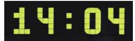
4-stellige Anzeige, s. Pos. 2a

6 Stellen , 1-zeilig, einseitig lesbar , ohne Zusatz-Beschriftungen