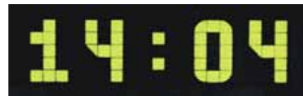
4-stellige Anzeige, s. Pos. 2a

Abmessungen : 500 x 300 x 130 mm ( B x H x T ), Schutzart : IP 54, Versorgungsspannung : 230 V AC mit DCF-77 - Funkempfänger , absetzbar für optimalen Empfangsstandort sowie mit Außentemperaturfühler mit 10 m Kabel