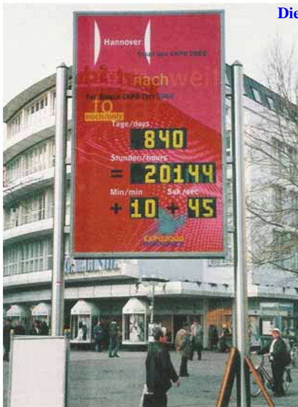
LCD-Countdownuhr doppelseitig, für EXPO 2000 in Hannover, Zifferhöhe 220 mm. Seit der EXPO zählt die Anzeige vorwärts.

Die EXPO-Uhr zur EXPO 2000 in Hannover ( als Mosaikanzeige )